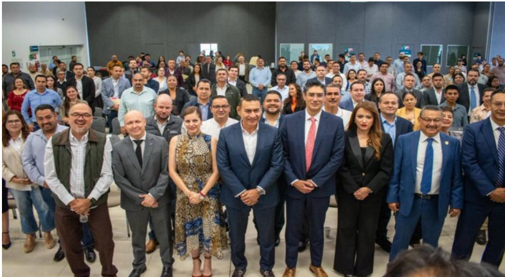
Imagen 3. El reto de la integridad en los municipios: coordinación entre prevención, fiscalización y sanción