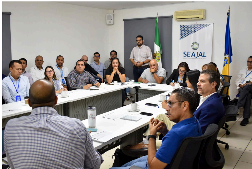
Imagen 5. Taller de implementación con la Coordinación General Estratégica de Gestión del Territorio