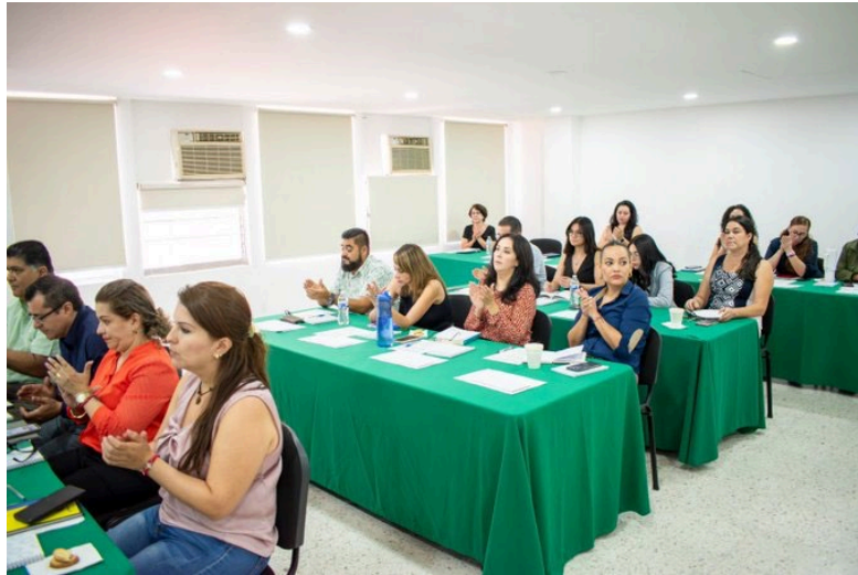
Imagen 6. Taller de implementación con el Tribunal Electoral del Estado de Jalisco