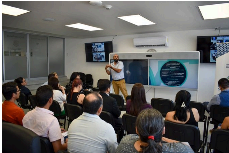
Imagen 4. Taller de implementación con el Consejo de la Judicatura del Poder Judicial del Estado de Jalisco

En el marco de la implementación de la PEAJAL, se realizaron cinco talleres de implementación, en los cuales participaron los siguientes entes: el Consejo de la Judicatura del Poder Judicial del Estado de Jalisco, la Coordinación General de Gestión del Territorio y sus entes sectorizados, el Tribunal Electoral del Estado de Jalisco, la Procuraduría Social, y la Secretaría del Medio Ambiente y Desarrollo Territorial.