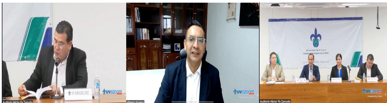
Imagen 12. Presentación del libro “El derecho humano a una vida libre de corrupción”

También se participó de manera virtual en la presentación del libro “ El derecho humano a una vida libre de corrupción ”. El evento fue organizado por el Instituto de Investigaciones Jurídicas, Región Xalapa, de la Universidad Veracruzana.