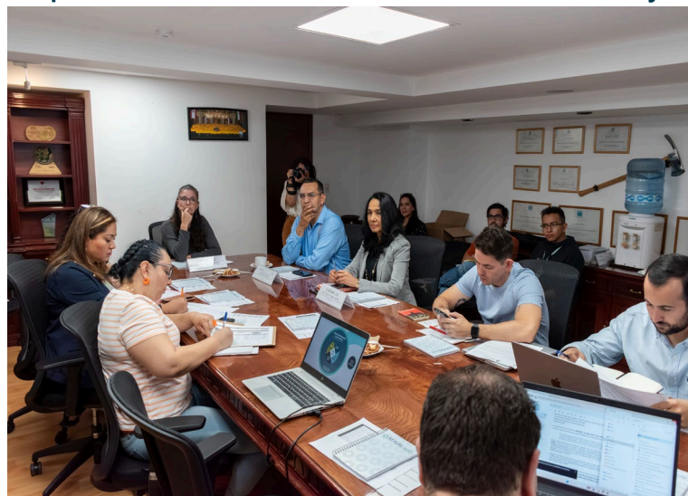
Imagen 8. Taller de implementación con la Secretaría del Medio Ambiente y Desarrollo Territorial