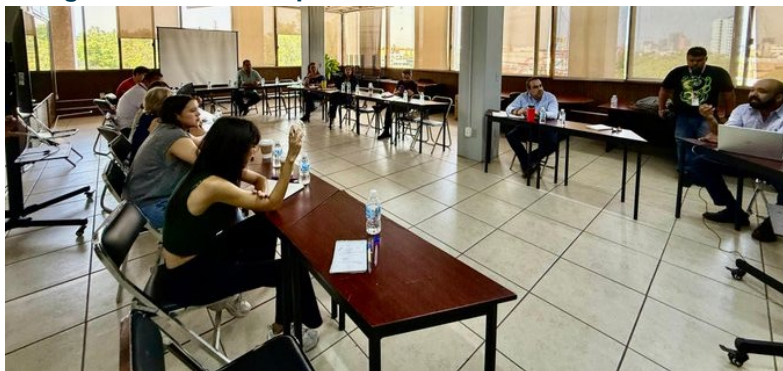
Imagen 7. Taller de implementación con Procuraduría Social