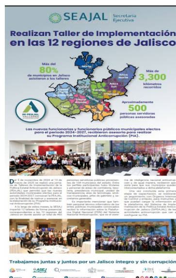
Imagen 10. Newsletter “Talleres de Implementación en las 12 Regiones de Jalisco”

Se desarrollaron materiales como postales y newsletter sobre los Talleres de Implementación de la PEAJAL en diversas dependencias y municipios. De igual manera se desarrollaron postales informativas sobre las sesiones de los órganos colegiados del SEAJAL.