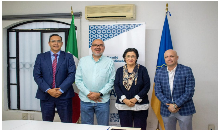
Imagen 13. Segunda Sesión Ordinaria de Comité Coordinador

Adicionalmente, se da seguimiento permanente al proceso de elaboración, validación jurídica y publicación, previa aprobación y firma de integrantes de cada órgano colegiado, de las actas y documentos anexos respectivos.