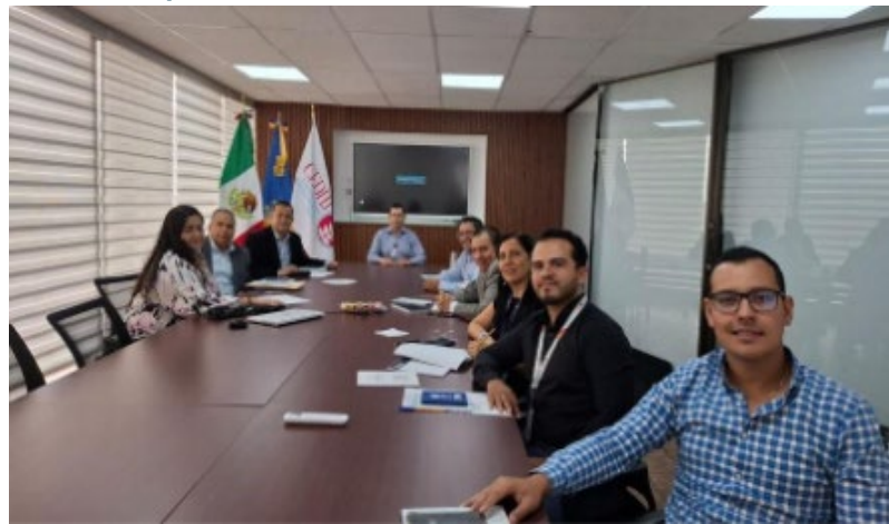
Imagen 4. Taller de implementación Comisión Estatal de Derechos Humanos Jalisco