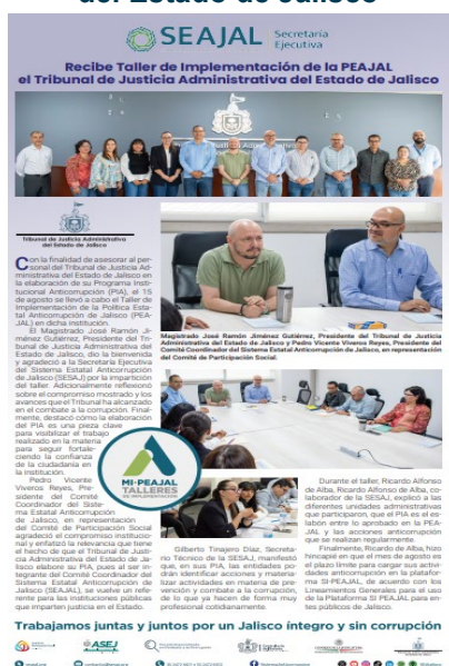
Imagen 8. Newsletter Taller de Implementación de la PEAJAL el Tribunal de Justicia Administrativa del Estado de Jalisco

Se desarrollaron materiales como postales y newsletter sobre los Talleres de Implementación de la PEAJAL en diversas dependencias y municipios. De igual manera se desarrollaron postales informativas sobre las sesiones de los órganos colegiados del SEAJAL.