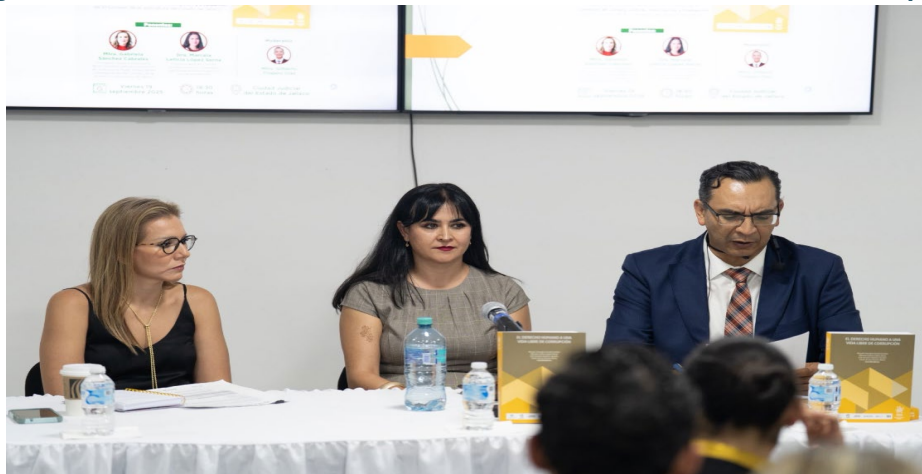
Imagen 9. Presentación Libro “El Derecho Humano a una vida libre de corrupción”

Además, se participó en la Segunda Sesión Ordinaria del Comité Coordinador del Sistema Municipal Anticorrupción de Guadalajara; en el Conversatorio sobre el Control y Legalidad en el Manejo del Recurso Público y, en el Primer Encuentro Estatal Anticorrupción 2025.