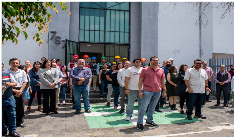
Imagen 7. Personal SESAJ en el Simulacro Nacional 2025

Con la finalidad de contribuir con el fortalecimiento de las capacidades de reacción de la brigada de protección civil y del personal de la SESAJ ante la eventualidad de una emergencia, el personal de la Secretaría Ejecutiva participó de manera proactiva en el Simulacro Nacional, realizado el 19 de septiembre de 2025.