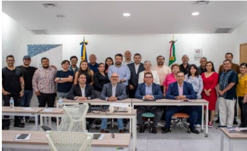
Imagen 3. Taller de implementación Archivo General del Estado de Jalisco