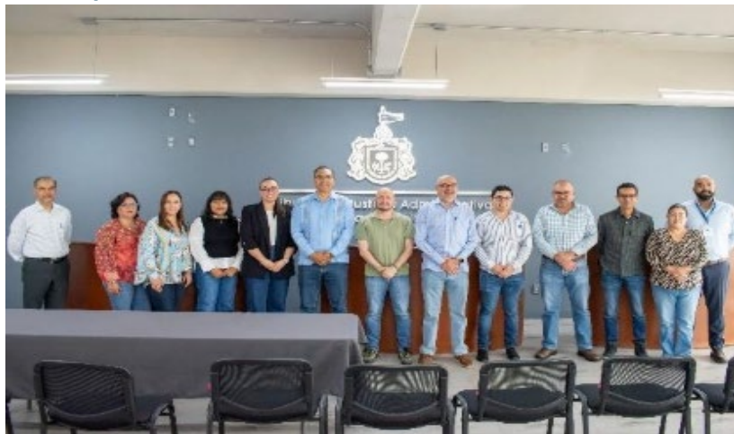
Imagen 5. Taller de implementación Tribunal de Justicia Administrativa del Estado de Jalisco