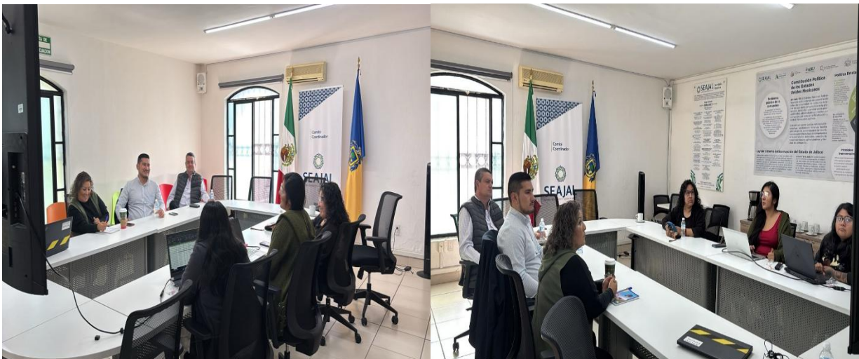
Imagen 4. Reunión con personal del Órgano Interno de Control del Municipio de Tonalá

En este contexto, el Sistema de Inteligencia se perfila como un instrumento estratégico para consolidar la coordinación entre los ámbitos estatal y municipal, mejorar el aprovechamiento de la información disponible y avanzar de manera tangible en la prevención y detección de faltas administrativas y hechos de corrupción, contribuyendo así al fortalecimiento institucional y a la confianza ciudadana en el SEAJAL.