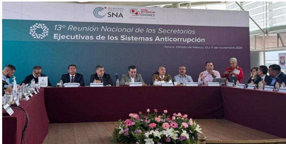
Imagen 10. Décima Tercera Reunión Nacional de las Secretarías Ejecutivas de los Sistemas Anticorrupción

públicas”; así como del Programa Educativo para la Prevención de Actos de Corrupción, entre otros temas.