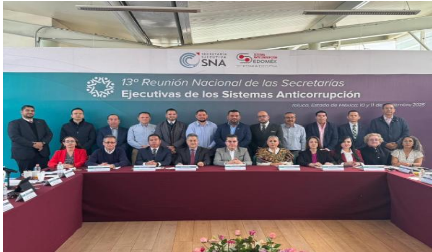
Imagen 11. Décima Tercera Reunión Nacional de las Secretarías Ejecutivas de los Sistemas Anticorrupción