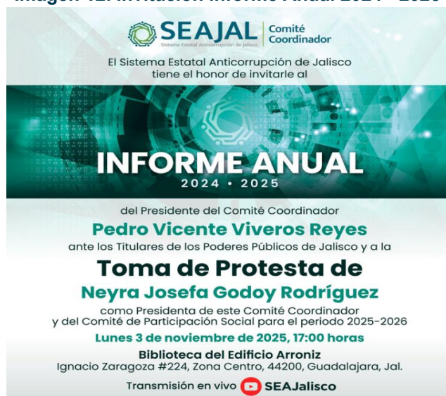
Imagen 12. Invitación Informe Anual 2024 - 2025

Se realizaron materiales de sensibilización, difusión y promoción del SEAJAL, específicamente durante este cuarto trimestre se realizaron piezas gráficas y audiovisuales sobre la Firma de Compromisos por la PEAJAL, el Informe de Actividades 2024-2025 del Comité Coordinador, las Jornadas Anticorrupción y la participación en el stand "El derecho a saber" en el marco de la FIL Guadalajara 2025.