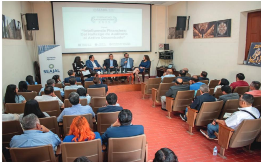
Imagen 5. Tercera Jornada Anticorrupción: “Inteligencia Financiera: Del Hallazgo de Auditoría al Activo Decomisado”

La Jornada incluyó un espacio de participación del público, lo que permitió ampliar la reflexión colectiva y fortalecer el enfoque colaborativo del ejercicio. En conjunto, la realización de la Tercera Jornada Anticorrupción contribuyó a reforzar la coordinación interinstitucional y a generar insumos relevantes para el diseño y fortalecimiento de políticas públicas en materia de integridad financiera y combate a la corrupción.