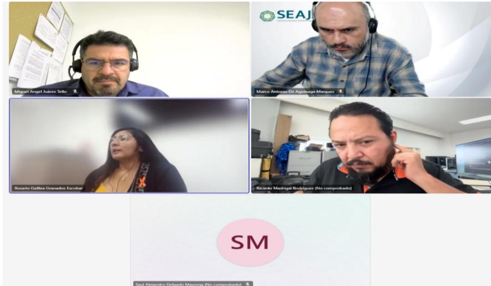
Imagen 3. Reunión con el Gobierno Municipal de Tlajomulco de Zúñiga

Guadalajara y la Agencia Metropolitana de Servicios de Infraestructura para la Movilidad del Área Metropolitana de Guadalajara, lo que representa un avance significativo en la ampliación de la cobertura estatal del sistema.