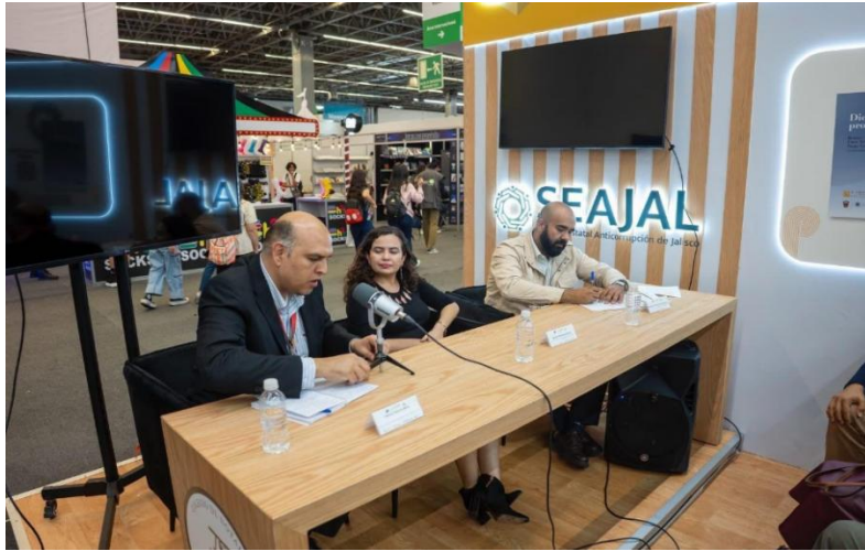
Imagen 6. Primer Panel Cuarta Jornada Anticorrupción: “Integridad archivística y memoria institucional”