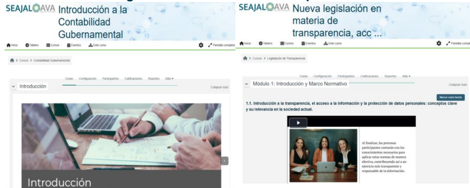
Fuente: Plataforma AVA