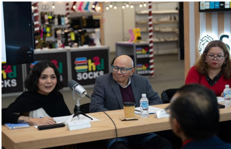
Imagen 7. Segundo Panel Cuarta Jornada Anticorrupción: “Integridad archivística y memoria institucional”

El panel profundizó en la relevancia de la integridad archivística como elemento clave para la memoria institucional, la transparencia y la rendición de cuentas, en alienación con los Programas MI-PEAJAL en materia de capacitación archivística, fortalecimiento de sistemas de gestión documental y auditorías archivísticas. Esta actividad complementó las acciones de sensibilización y difusión realizadas durante las Jornadas Anticorrupción 2025.