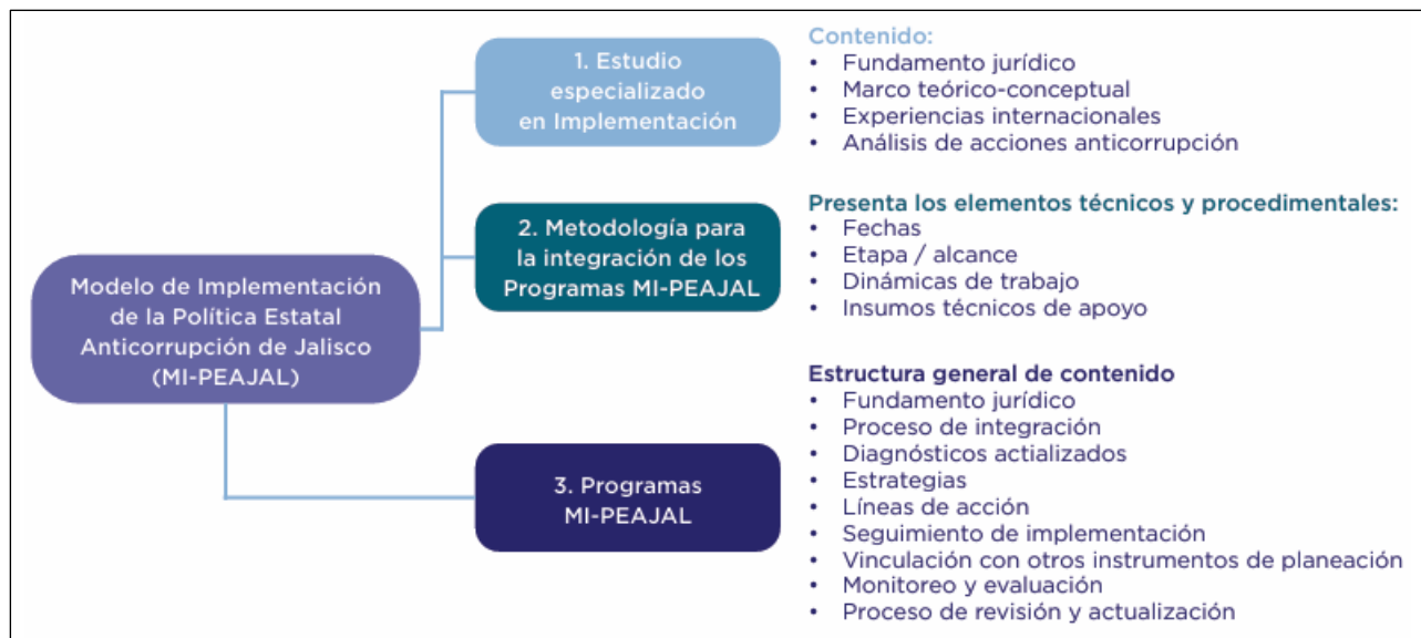
Figura 1. Modelo de Implementación aprobado por el CC