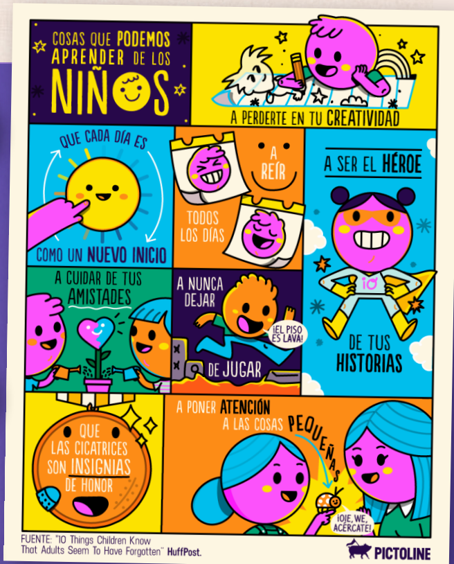
FUENTE: "10 Things Children Know That Adults Seem To Have Forgotten" HuffPost.