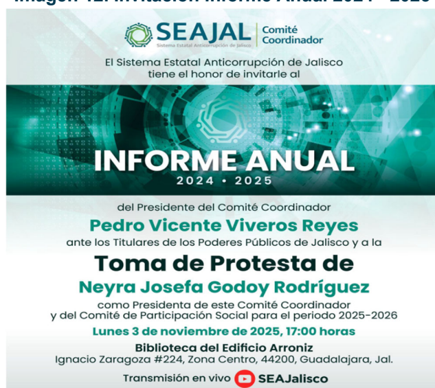
Imagen 12. Invitación Informe Anual 2024 - 2025

Se realizaron materiales de sensibilización, difusión y promoción del SEAJAL, específicamente durante este cuarto trimestre se realizaron piezas gráficas y audiovisuales sobre la Firma de Compromisos por la PEAJAL, el Informe de Actividades 2024-2025 del Comité Coordinador, las Jornadas Anticorrupción y la participación en el stand "El derecho a saber" en el marco de la FIL Guadalajara 2025.