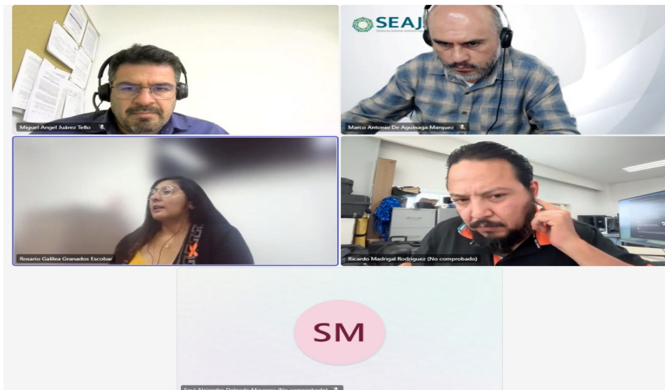
Imagen 3. Reunión con el Gobierno Municipal de Tlajomulco de Zúñiga

Guadalajara y la Agencia Metropolitana de Servicios de Infraestructura para la Movilidad del Área Metropolitana de Guadalajara, lo que representa un avance significativo en la ampliación de la cobertura estatal del sistema.