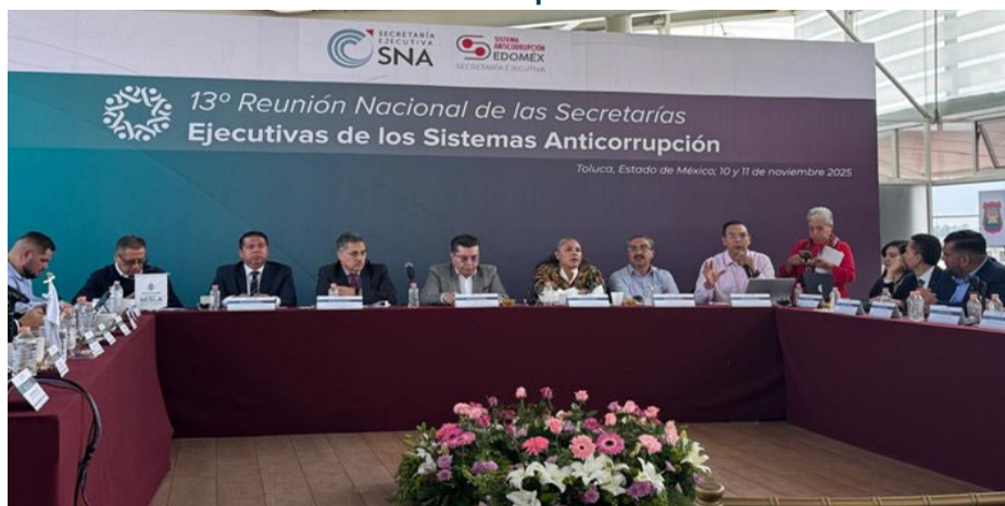
Imagen 10. Décima Tercera Reunión Nacional de las Secretarías Ejecutivas de los Sistemas Anticorrupción

públicas”; así como del Programa Educativo para la Prevención de Actos de Corrupción, entre otros temas.