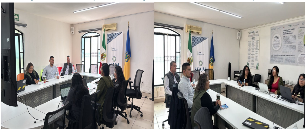
Imagen 4. Reunión con personal del Órgano Interno de Control del Municipio de Tonalá

En este contexto, el Sistema de Inteligencia se perfila como un instrumento estratégico para consolidar la coordinación entre los ámbitos estatal y municipal, mejorar el aprovechamiento de la información disponible y avanzar de manera tangible en la prevención y detección de faltas administrativas y hechos de corrupción, contribuyendo así al fortalecimiento institucional y a la confianza ciudadana en el SEAJAL.