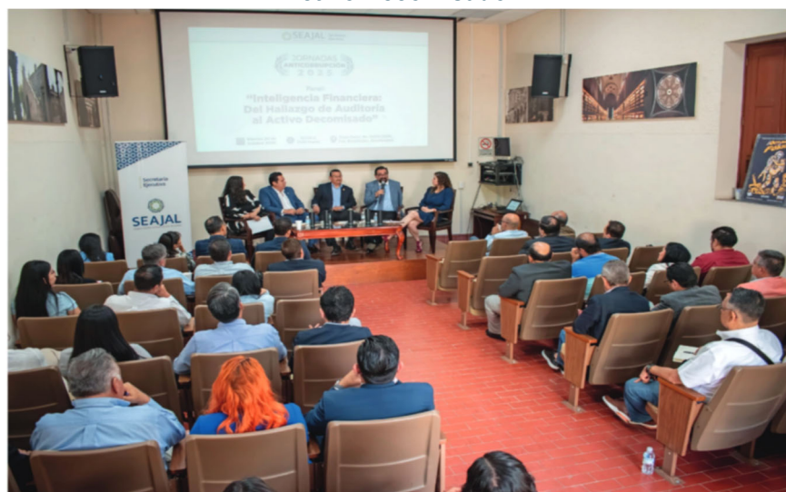
Imagen 5. Tercera Jornada Anticorrupción: “Inteligencia Financiera: Del Hallazgo de Auditoría al Activo Decomisado”

La Jornada incluyó un espacio de participación del público, lo que permitió ampliar la reflexión colectiva y fortalecer el enfoque colaborativo del ejercicio. En conjunto, la realización de la Tercera Jornada Anticorrupción contribuyó a reforzar la coordinación interinstitucional y a generar insumos relevantes para el diseño y fortalecimiento de políticas públicas en materia de integridad financiera y combate a la corrupción.