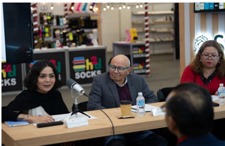
Imagen 7. Segundo Panel Cuarta Jornada Anticorrupción: “Integridad archivística y memoria institucional”

El panel profundizó en la relevancia de la integridad archivística como elemento clave para la memoria institucional, la transparencia y la rendición de cuentas, en alienación con los Programas MI-PEAJAL en materia de capacitación archivística, fortalecimiento de sistemas de gestión documental y auditorías archivísticas. Esta actividad complementó las acciones de sensibilización y difusión realizadas durante las Jornadas Anticorrupción 2025.