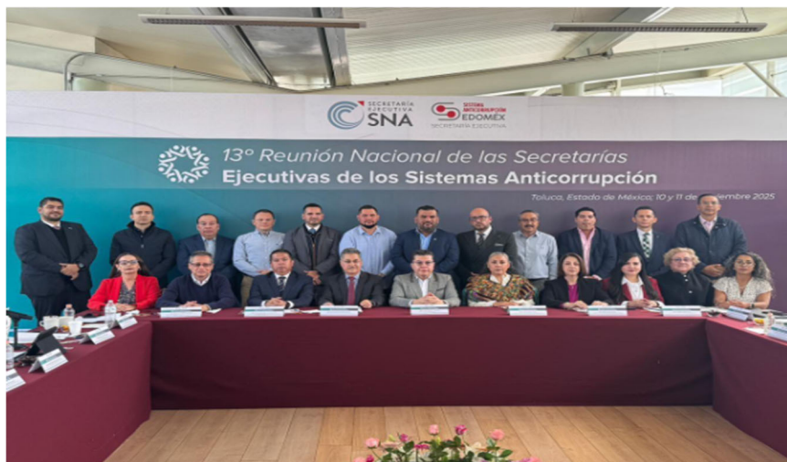
Imagen 11. Décima Tercera Reunión Nacional de las Secretarías Ejecutivas de los Sistemas Anticorrupción