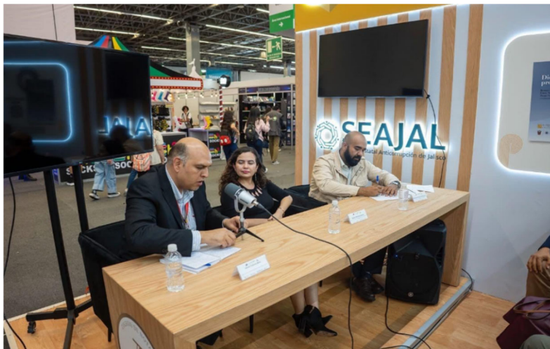
Imagen 6. Primer Panel Cuarta Jornada Anticorrupción: “Integridad archivística y memoria institucional”